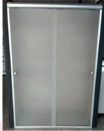
CANCEL DE BAÑO VIDRIO CLARO ESMERILADO COMPLETO