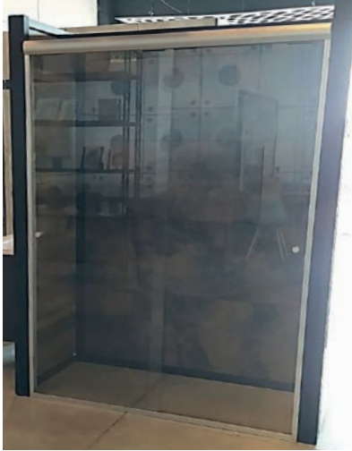
CANCEL DE BAÑO VIDRIO CLARO