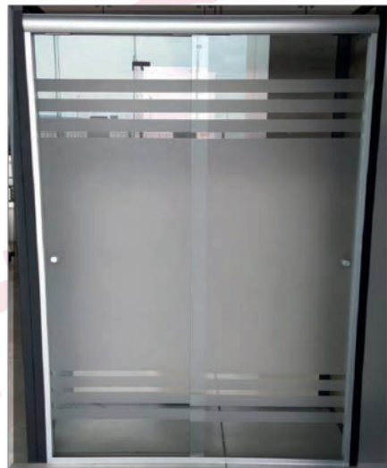
CANCEL DE BAÑO VIDRIO CLARO ESMERILADO CON DISEÑO

*Imagen de referencia, las medidas y diseños pueden cambiar a discreción de Grupo RI. *Los materiales y aditamentos descritos son de referencia, por lo que pueden ser sustituidos a discreción de Grupo RI.